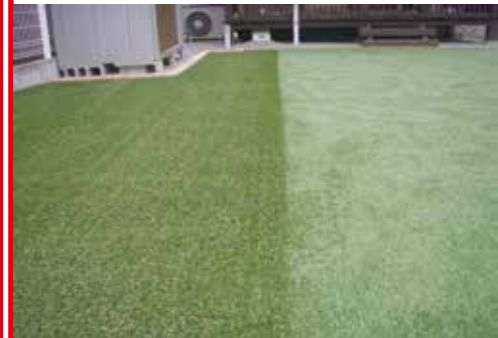
芝目の合わせ不良