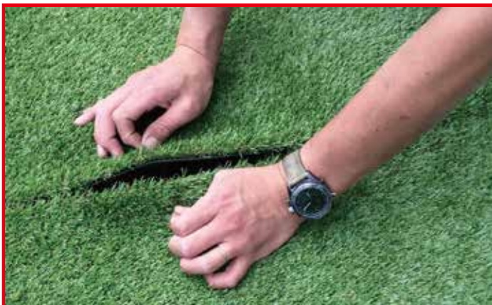
継目を調整し、貼り合わせている様子