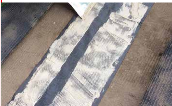
ジョイントシートに接着剤を塗布する様子 (写真は下地が土)